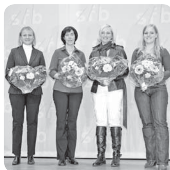
■ erfolgreiche Absolventinnen