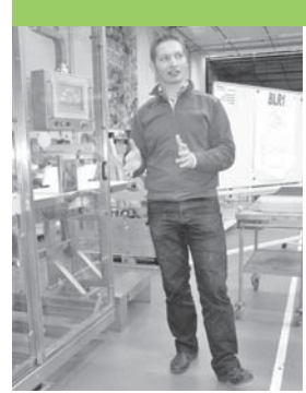
■ Technik vom Feinsten – vorgeführt vom Techniker HF

Der Betriebsrundgang bildete das Highlight: Sämtliche Kompetenzfelder der Ausbildungen «SPS-Steuerungstechniker», «Automatikfachmann» sowie «Techniker HF Automation» konnten in der Praxis beobachtet werden. Beim anschliessenden Apéro standen die Geschäftsleitung sowie qualifizierte MitarbeiterInnen Red und Antwort.